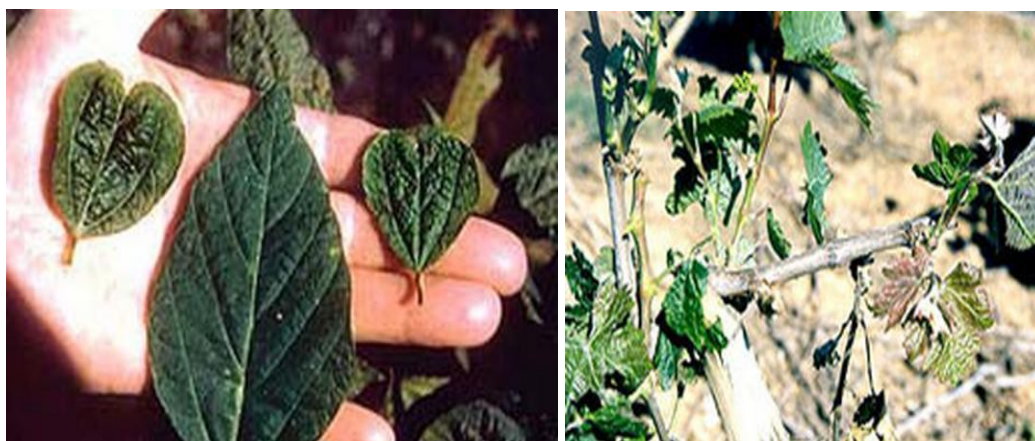
Εικόνα 3.2.2.1: Ζημιές στα φυτά

Ζημιά από την αρκούδα (URSUS ARCTOS) που καλύπτει η ασφάλιση του ΕΛ.Γ.Α., θεωρείται η καταστροφή ή η απώλεια της φυτικής παραγωγής η οποία προκαλείται από το ζώο αυτό. Ζημιά από το αγριογούρουνο (Sus sp.) που καλύπτει η ασφάλιση του ΕΛ.Γ.Α., θεωρείται η καταστροφή ή η απώλεια της φυτικής παραγωγής των συστηματικών καλλιεργειών που αναπτύσσονται στις περιοχές που προστατεύονται από τη συνθήκη RAMSAR, η οποία προκαλείται από το ζώο αυτό 60 .