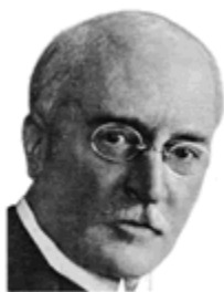
Δρ. Ρούντολφ Ντίζελ

Η ιστορία των βιοελαίων ως καύσιμα κίνησης ξεκινά πριν από έναν αιώνα όταν ο Ρούντολφ Ντίζελ (R. Diesel) κατασκεύασε τον Αύγουστο του 1893 τον ομώνυμο κινητήρα, χρησιμοποιώντας ως καύσιμο για τη λειτουργία του το αραχιδέλαιο (φυστικέλαιο). Λίγα χρόνια αργότερα ο Ρούντολφ Ντίζελ προφητικά δηλώνει: «Η χρήση φυτικών ελαίων σαν καύσιμα μηχανών φαίνεται ασήμαντη σήμερα. Όμως τέτοια έλαια μπορεί να γίνουν με την πάροδο του χρόνου τόσο σημαντικά όσο είναι σήμερα το πετρέλαιο και το κάρβουνο».