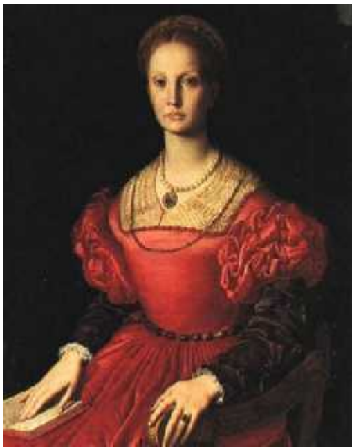
. 9.1 μ

16 ) μ μ ( , μμ ) . μ μ μ μ μ μ μ . μ μ μ . μ μ μ μ μ . μ μ μ μ μ . μ μ μ μ μ . μ μ μ μ μ .