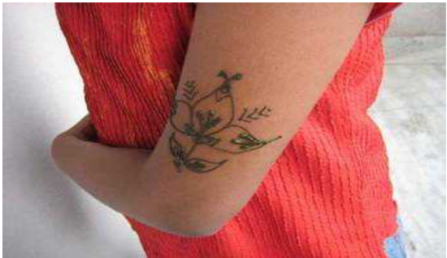
. 16.2 μ ( : www.google.com)

μμ , μ , μ , μ . 3 μ . μ μ μ , μ μ μ . μ μ μ μ , μ μ μ μ . , 1691 μ μ μ μ , 17 μ . 18 , μ μ 19 . μ μ μ “tattoo”, μ “ta”, μ μ . μ , μ μ , μ , μ μ , μ .