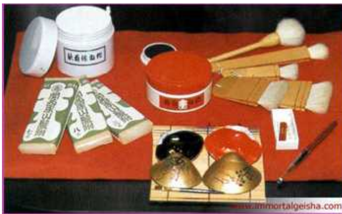
. 14.4.4 μ μ ( : www.google.com )

μ μ μ « » μ . μ , geisha μ , μ , μ make up. μ , μ Muromachi (1.333-1.573), μ μ μ Edo (1.600-1.868) μ μ μ : , μ , μ . , μ μ benibana , μ μ , μ μ μ μ μ μ , μ μ μ . μ μ μ μ . Meiji, μ μ μ Meiji μ μ μ , μ Taish (1912-1926) μ , μ , μ ,