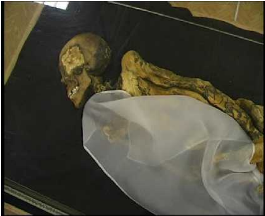
. 2.2 , μ μ μ

, μ , μ , (10.300-7.000 . . ) μ , μ , μ μ , μ μ , μ μ , μ μ 7.000 . . 1.500 . . μ , Ain Ghazal μ 8.000 . . μ , μ , μ μ , μ μ 5.000 3.000 . . , μ μ μ , μ μ μ , μ .