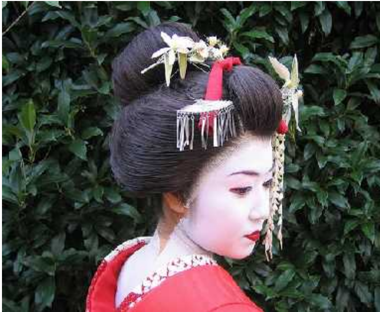
. 14.4.3 Geisha ( : www.google.com)

/ , μ , μ bintsuke-abura. μ . , μ μ , μ μ μ μ . , μ μ μ μ μ μμ μ «V» , μ μ Maiko μμ . , μ μ μ μ . , μ μ μ μ μ μ μ μ . μ μ μ μ μ Maiko Geisha μ μ μ μ μ . , μ μ μ μ . μ μ μ μ - μ μ μ benibana- μ , μ μ . , Maiko μ μ μμ , . , . Geisha μ μ μ . μ