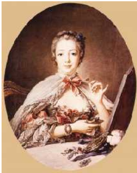
. 11.2 μ , μ , Francois Boucher, , 1758

μ Beaumont, « » (1.752), Sir Henry μ μ , μ μ , μ , μ μ μ , μ μ μ μ μ , μ μ , μ , μ μ μ μ , , μ μ .