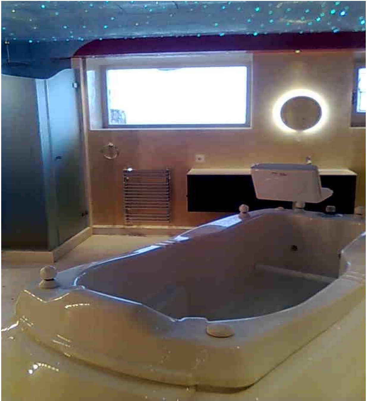
Μπανιέρα – τζακούζι στο προσβάσιμο μπάνιο