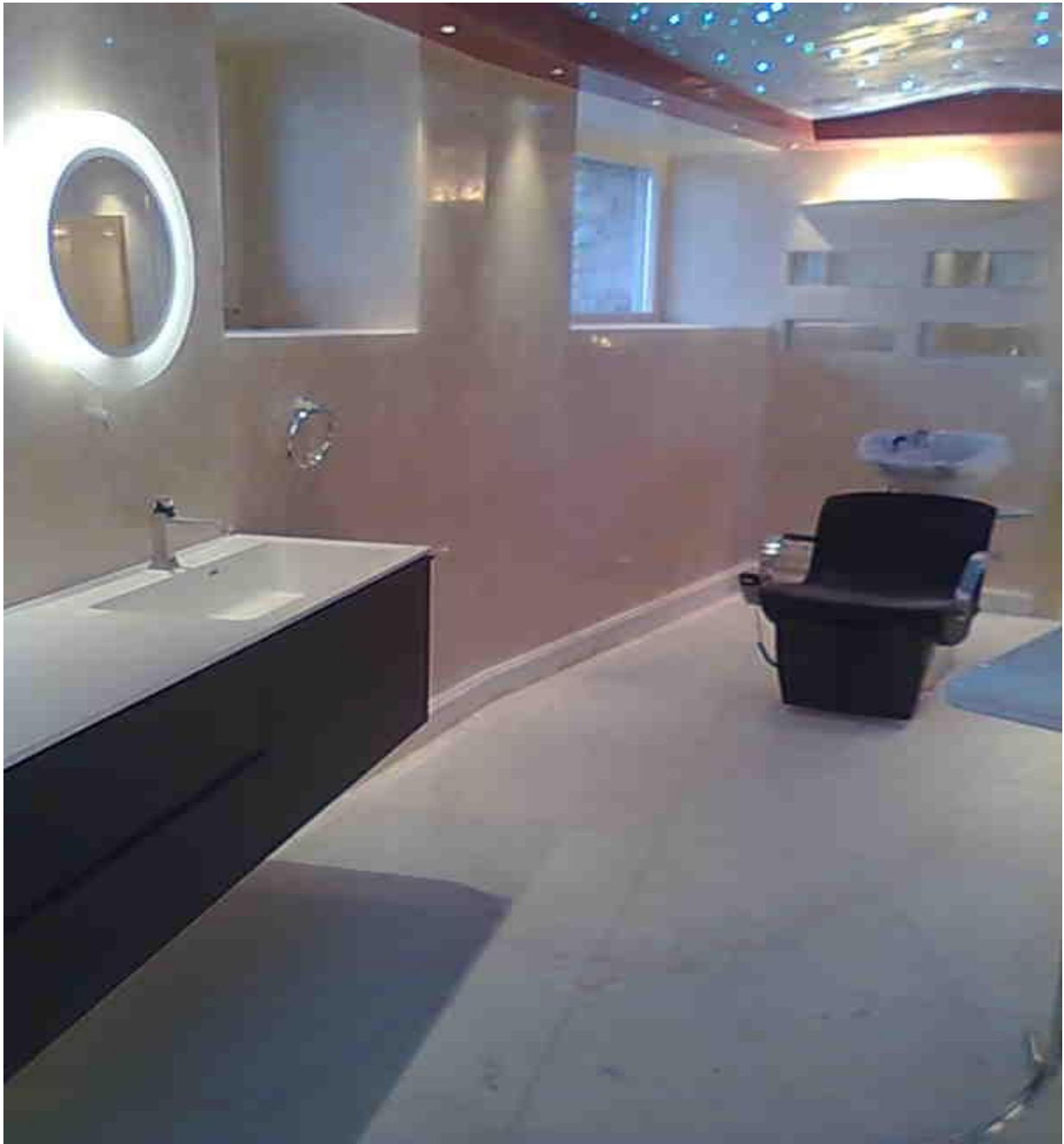
Προσβάσιμο μπάνιο στο ξενοδοχείο Mykonos Grand