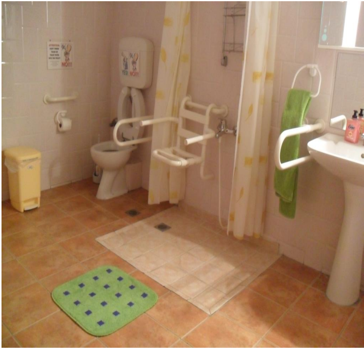
Προσβάσιμο μπάνιο στο διαμέρισμα Ηρακλής

Αυτό το διαμέρισμα έχει χωρητικότητα από ένα έως και τέσσερα άτομα, μέχρι ένα άτομο με αναπηρικό αμαξίδιο (ή δύο εάν μοιράζονται το ίδιο διπλό κρεβάτι) και διαθέτει: μία προσβάσιμη κρεβατοκάμαρα για δύο άτομα (με διπλό κρεβάτι), μία κρεβατοκάμαρα για δύο άτομα με διπλό κρεβάτι (δεν είναι προσβάσιμη με αμαξίδιο), καθιστικό με δύο καναπέδες, κλιματιστικό και τζάκι, κουζίνα, προσβάσιμο μπάνιο και μπαλκόνι με θέα στην θάλασσα. Οι δύο κρεβατοκάμαρες κλιματίζονται.