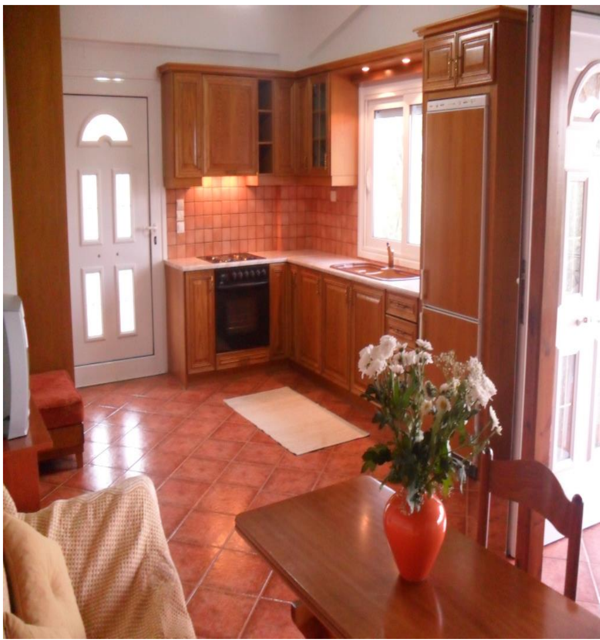
Μία άποψη της κουζίνας στο διαμέρισμα Ιοκάστη