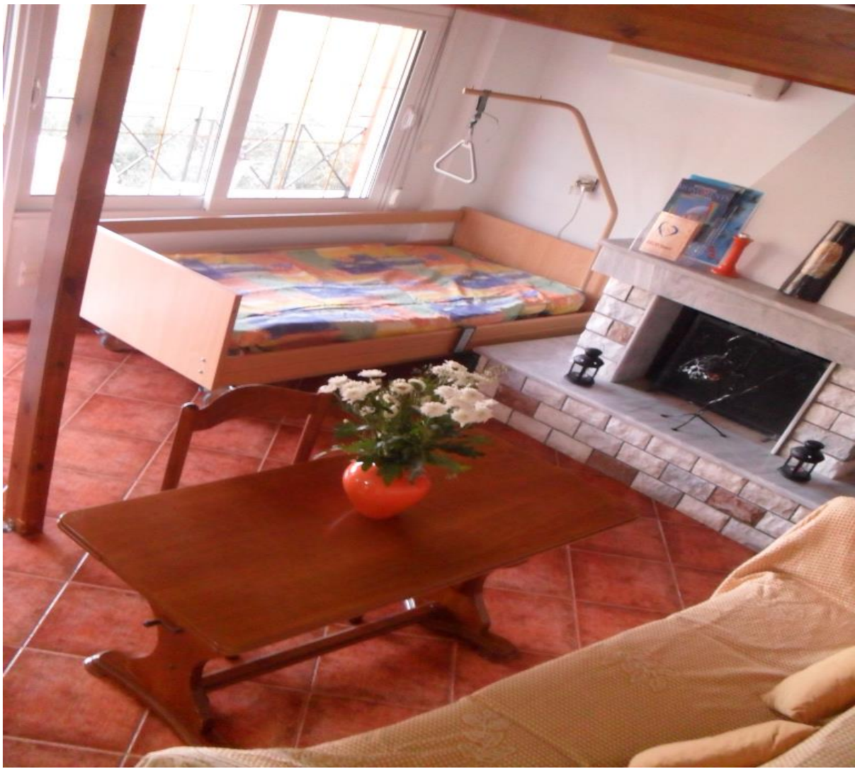
Προσβάσιμο με αμαξίδιο μονό κρεβάτι στο καθιστικό του διαμερίσματος Ιοκάστη

Το διαμέρισμα Ιοκάστη προσφέρεται για να φιλοξενήσει από ένα έως τρία άτομα, μέχρι ένα άτομο με αμαξίδιο και διαθέτει: καθιστικό με ένα μονό κρεβάτι προσβάσιμο από αναπηρικό αμαξίδιο, ένα καναπέ, κλιματιστικό και τζάκι, μία κρεβατοκάμαρα με διπλό κρεβάτι (δεν είναι προσβάσιμη με αμαξίδιο), κουζίνα, πλήρως προσβάσιμο μπάνιο και μπαλκόνι με θέα στην θάλασσα. Η κρεβατοκάμαρα κλιματίζεται.