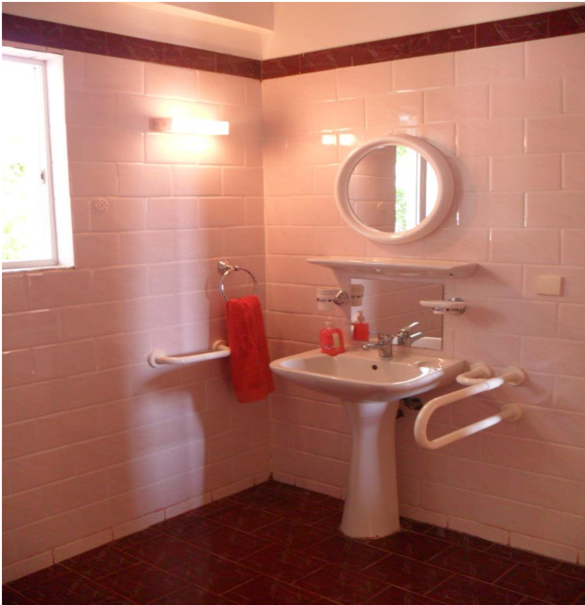
Ο νιπτήρας στο μπάνιο του διαμερίσματος Αφροδίτη

Το διαμέρισμα Αφροδίτη μπορεί να φιλοξενήσει από ένα έως τρία άτομα και μέχρι ένα άτομο σε αμαξίδιο και διαθέτει: καθιστικό με ένα μονό κρεβάτι προσβάσιμο για ΑμεΑ με αμαξίδιο, ένα καναπέ, τζάκι και κλιματιστικό, μία κρεβατοκάμαρα με ένα διπλό κρεβάτι (δεν είναι προσβάσιμη για αναπηρικό αμαξίδιο), κουζίνα, προσβάσιμη τουαλέτα και μπαλκόνι με θέα στην θάλασσα. Η κρεβατοκάμαρα κλιματίζεται.