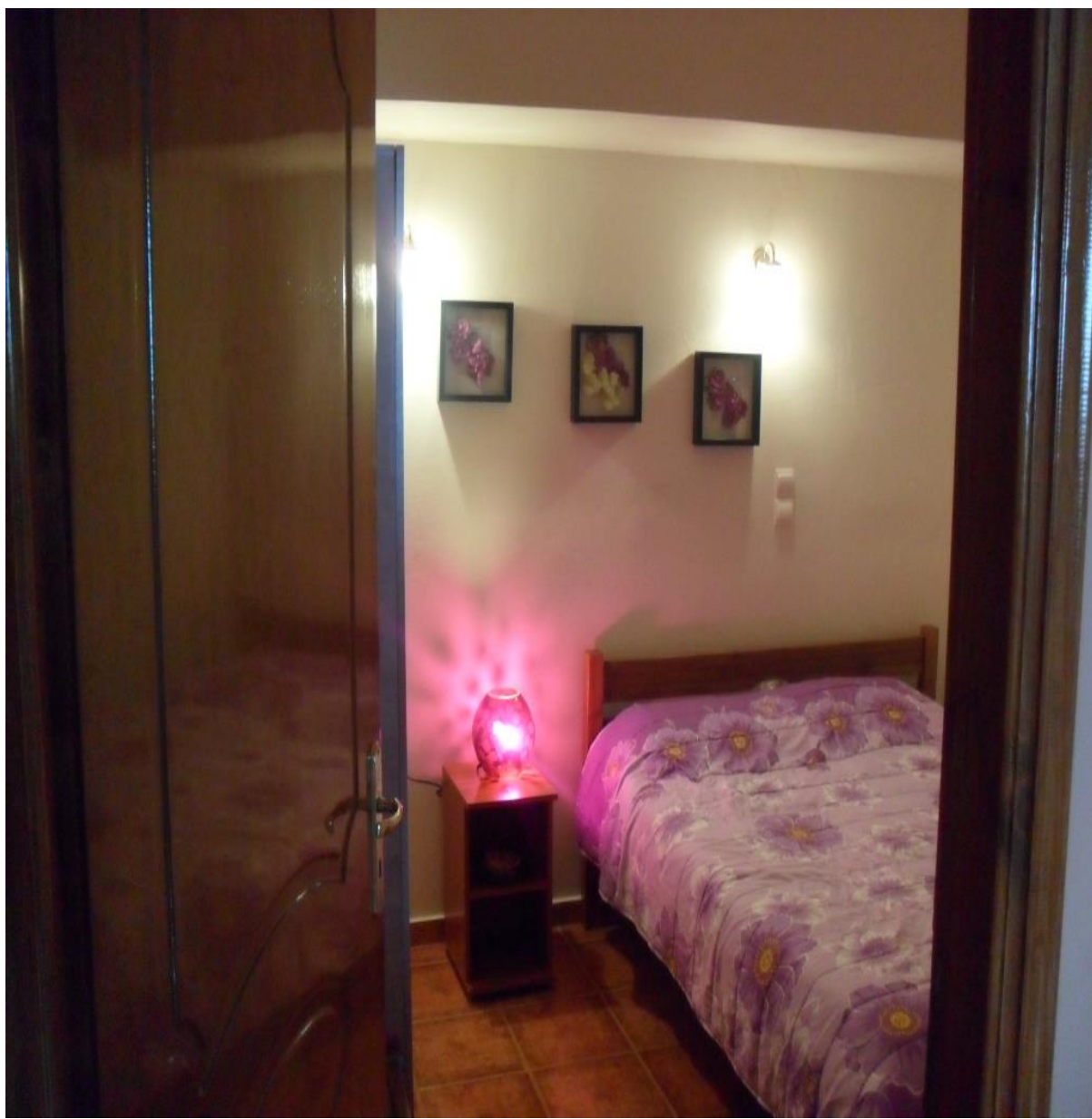
Μία από τις προσβάσιμες κρεβατοκάμαρες (με διπλό κρεβάτι) του διαμερίσματος Οδυσσέας