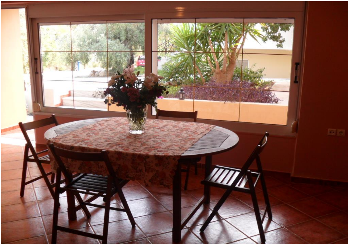
Χώρος σε στυλ τραπεζαρία στο διαμέρισμα Οδυσσέας

Το διαμέρισμα Οδυσσέας είναι με χωρητικότητα από ένα έως και οκτώ άτομα, μέχρι τέσσερα άτομα με αναπηρικό αμαξίδιο και διαθέτει: τέσσερις προσβάσιμες κρεβατοκάμαρες, για δύο άτομα η κάθε μία από αυτές (δύο με διπλά κρεβάτια και δύο με δύο μονά κρεβάτια η κάθε μία από αυτές), δύο χώροι υγιεινής (το ένα μπάνιο είναι πλήρως προσβάσιμο για χρήστες αμαξιδίου), μεγάλο καθιστικό με τζάκι στο κέντρο, τηλεόραση και μεγάλο χώρο με τραπέζι για τα γεύματα, κουζίνα και μπαλκόνι με θέα στην θάλασσα. Όλες οι κρεβατοκάμαρες κλιματίζονται.