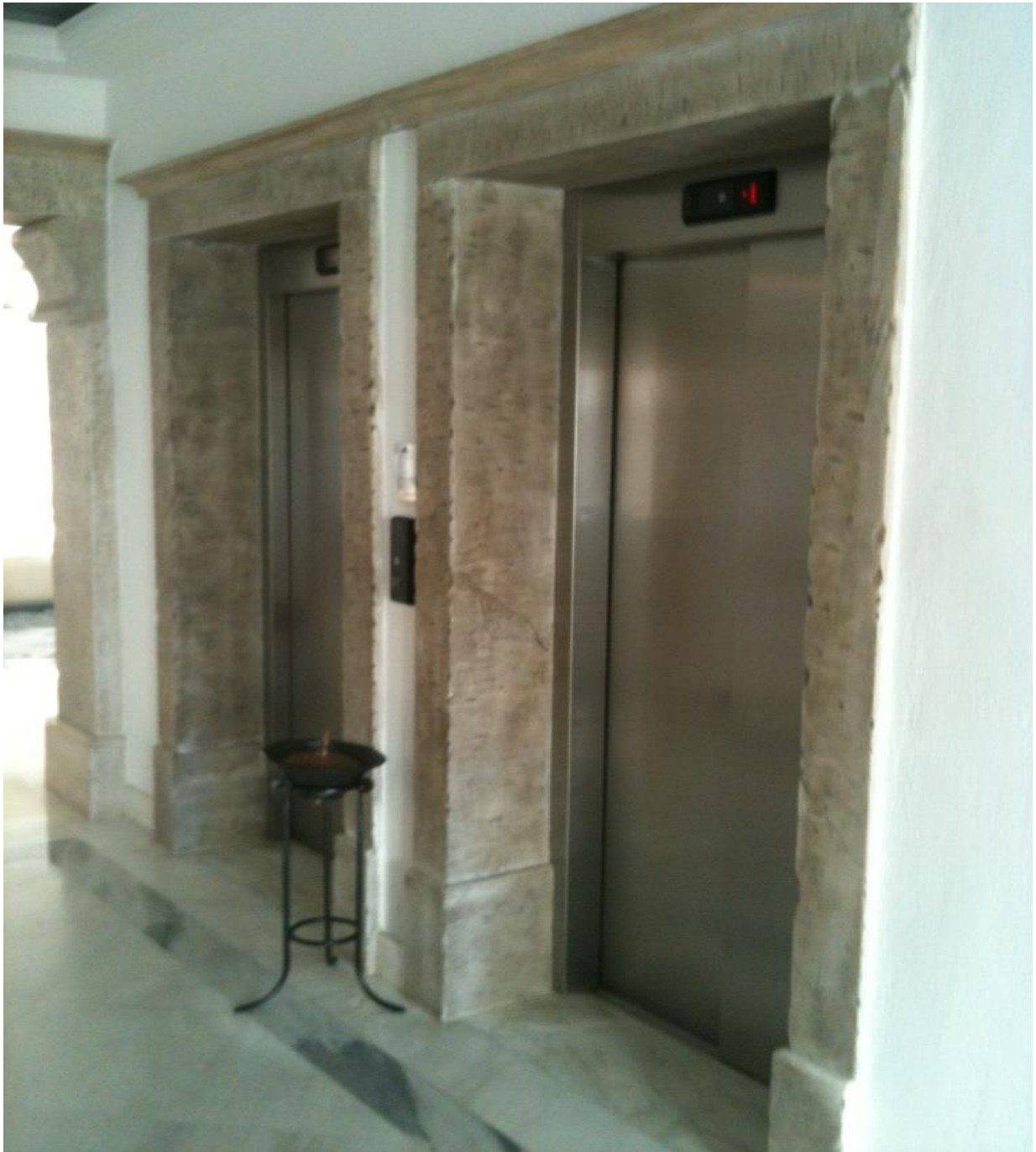
Εσωτερικοί ανελκυστήρες στο Mykonos Grand