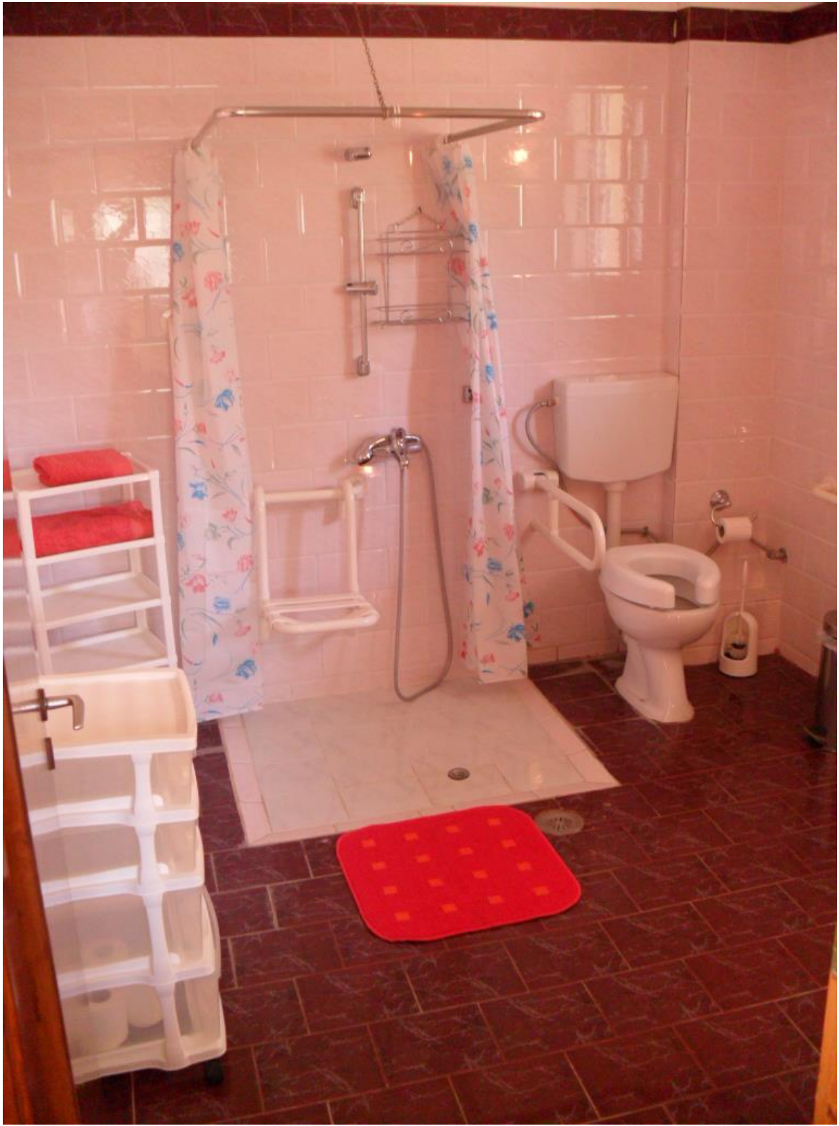
Ντουζιέρα και τουαλέτα στο διαμέρισμα Αφροδίτη