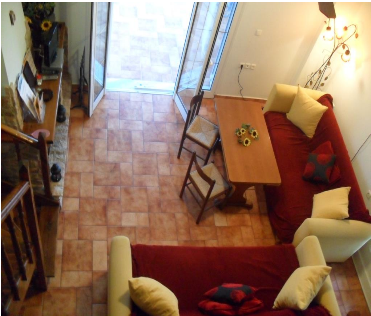
Χώρος καθιστικού στο διαμέρισμα Θυσέας

Το διαμέρισμα έχει χωρητικότητα από ένα έως τέσσερα άτομα, μέχρι ένα άτομο σε αναπηρικό αμαξίδιο (ή δύο εάν μοιράζονται το ίδιο διπλό κρεβάτι) και διαθέτει: μία προσβάσιμη κρεβατοκάμαρα για δύο άτομα (με διπλό κρεβάτι), μία κρεβατοκάμαρα για δύο άτομα (η οποία δεν είναι προσβάσιμη με αμαξίδιο) με δύο μονά κρεβάτια, καθιστικό με δύο καναπέδες, κλιματιστικό και τζάκι, κουζίνα, τουαλέτα (πλήρως προσβάσιμη) και μπαλκόνι με θέα στην θάλασσα. Και οι δύο κρεβατοκάμαρες κλιματίζονται.