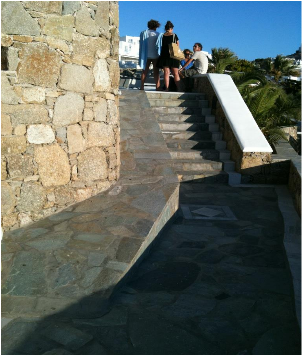
Μία από τις εξωτερικές σκάλες του συγκροτήματος Mykonos Grand Hotel & Resort