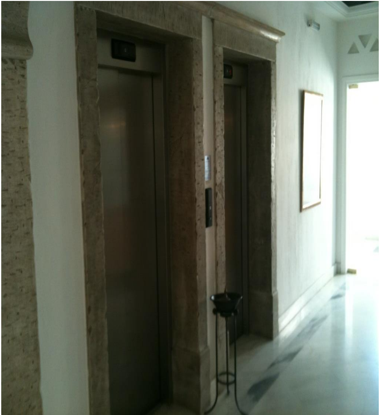
Κουμπί για το κάλεσμα του ανελκυστήρα σε ύψος προσβάσιμο από αμαξίδιο ΑμεΑ