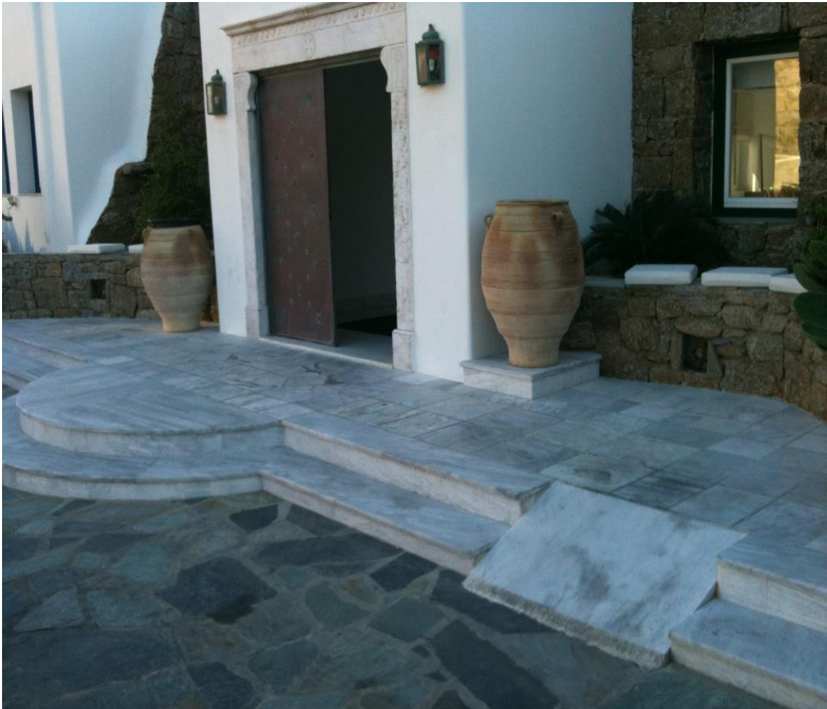
Ράμπα για αναπηρικό αμαξίδιο στην είσοδο του Mykonos Grand

Είναι ένα πολυτελές ξενοδοχειακό συγκρότημα στην Μύκονο, ονομάζεται “Mykonos Grand Hotel and Resort”, βρίσκεται στην περιοχή Άγιος Ιωάννης και διαθέτει: συνεδριακό κέντρο, εκκλησία, πισίνα για ενήλικες και παιδική πισίνα, μπαρ πισίνας, εστιατόριο, πάρκινγκ, κατάστημα δώρων, Spa και μία ιδιωτική παραλία. Οι ταξιδιώτες μπορούν να απολαύσουν το υπέροχο ηλιοβασίλεμα στην παραλία του Αγίου Ιωάννη και την όμορφη θέα της νήσου Δήλος. Το πέντε αστέρων ξενοδοχείο Mykonos Grand διαθέτει ένα δωμάτιο για ταξιδιώτες ΑμεΑ.