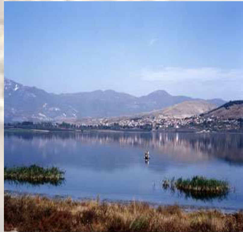
ΛΙΜΝΗ ΒΕΓΟΡΙΤΙΔΑ - ΠΕΡΙΟΧΗ ΑΡΝΙΣΣΑΣ