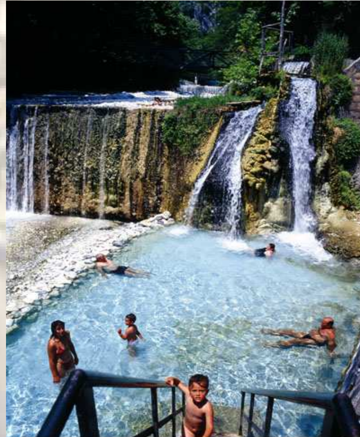
ΙΑΜΑΤΙΚΑ ΛΟΥΤΡΑ ΛΟΥΤΡΑΚΙΟΥ (ΠΟΖΑΡ)