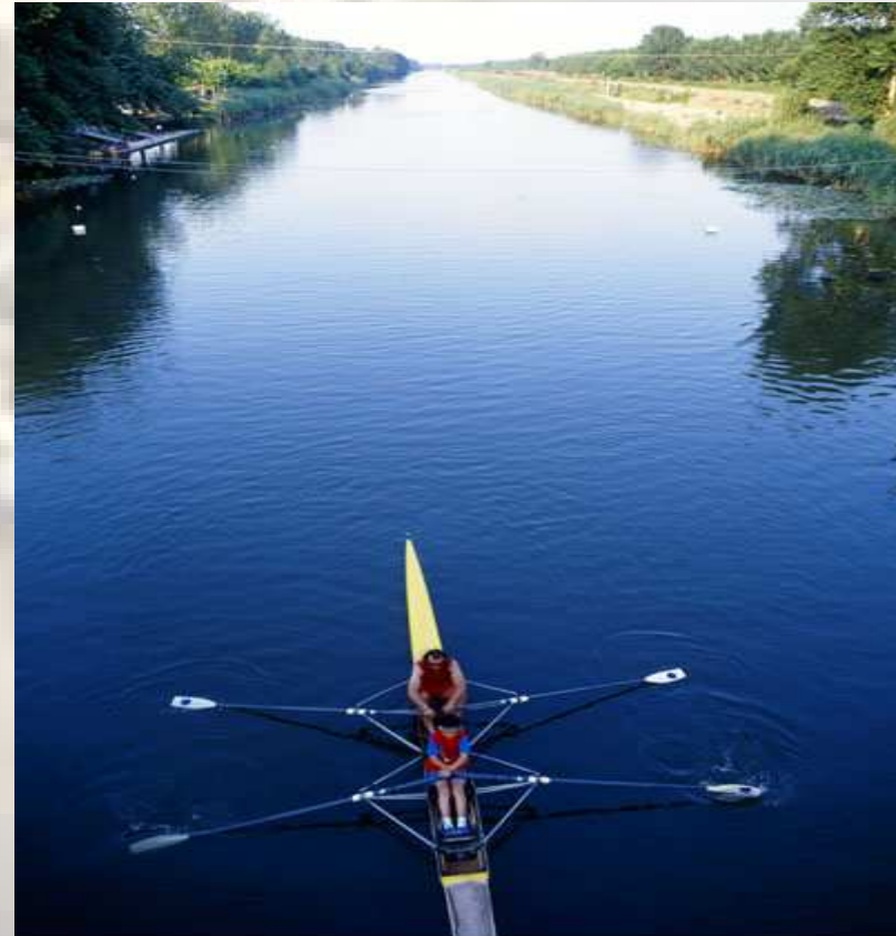
ΠΟΤΑΜΟΣ ΛΟΥΔΙΑΣ - ΚΩΠΗΛΑΤΙΚΟ ΚΕΝΤΡΟ