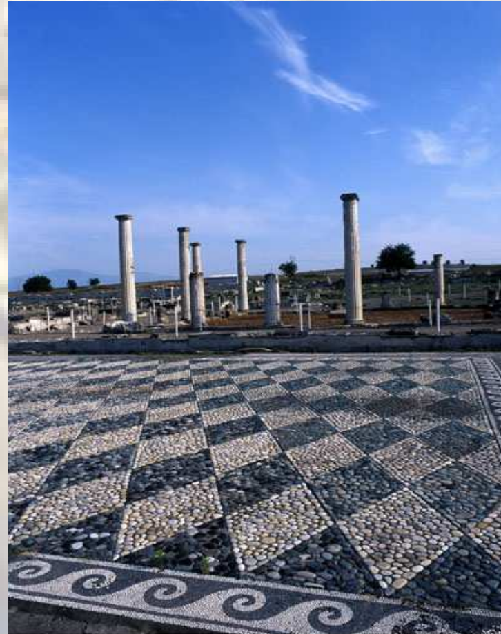
ΠΕΛΛΑ - ΑΡΧΑΙΟΛΟΓΙΚΟΣ ΧΩΡΟΣ