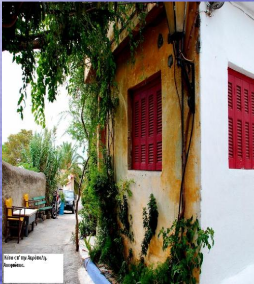
Είστε οπ' την Αγορά, Ανυφώτα.