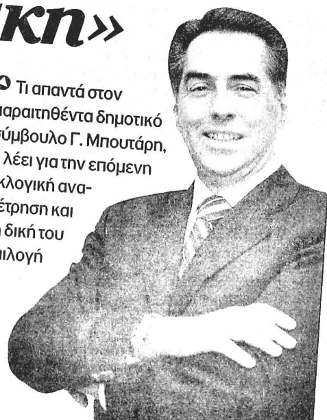
ΣΥΝΕΝΤΕΥΞΗ ΕΦ' ΟΛΗΣ ΤΗΣ ΥΛΗΣ ΣΕΛ/10-11