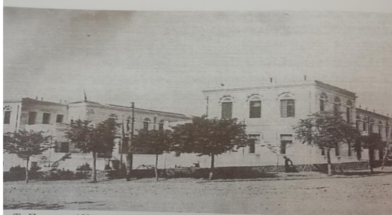
Εικόνα 1: Φωτογραφία του περασμένου αιώνα