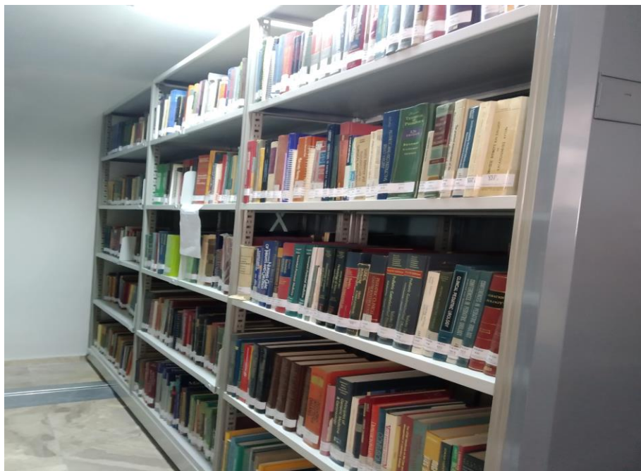
Εικόνα 3: Ερμάριο μετά το τέλος της οργάνωσης

Πραγματοποιήθηκε καταγραφή των τεκμηρίων στο Βιβλίο Εισαγωγής, εκτυπώθηκαν τα επισήματά τους (labels) και τέλος, τα βιβλία τοποθετήθηκαν στα ράφια σύμφωνα με τον ταξινομικό τους αριθμό.