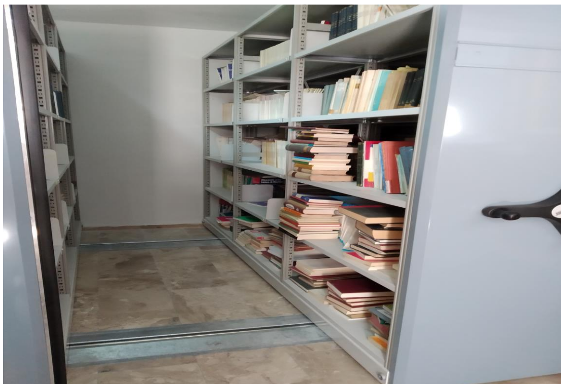
Εικόνα 2: Ερμάριο πριν από την οργάνωση