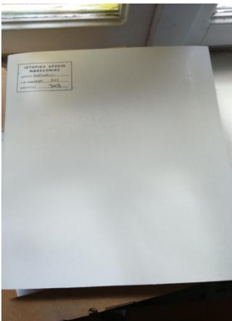
Εικόνα 8: Φάκελος 1

Αφού, συμπληρώνονταν τρεις λευκοί φάκελοι, τότε και οι τρεις τοποθετούνταν σε ένα κυτίο. Έξω από το κυτίο καταγράφεται το όνομα του αρχείου, ΑΒΕ, ΑΕΕ, η ενότητα και ο αύξοντας αριθμός του κυτίου.