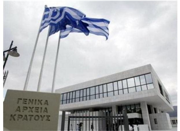
Εικόνα 2: Γενικά Αρχεία του Κράτους

Τα Γενικά Αρχεία του Κράτους (ΓΑΚ) ιδρύθηκαν με βάση το νόμο Ν.380/1914 «Περί της ιδρύσεως υπηρεσίας των αρχείων του κράτους». Ο καθηγητής Σπυρίδωνας Λάμπρου και ο ερευνητής-ιστορικός Γιάννης Βλαχογιάννης έκαναν υπεράνθρωπες προσπάθειες με σκοπό «την συναγωγήν και εποπτεΐαν πάντων των δημοσίων αρχείων των περιλαμβανόντων έγγραφα προ πεντηκονταετίας χρονολογούμενα». Ο νόμος ψηφίστηκε από την κυβέρνηση του Ελευθέριου Βενιζέλου.