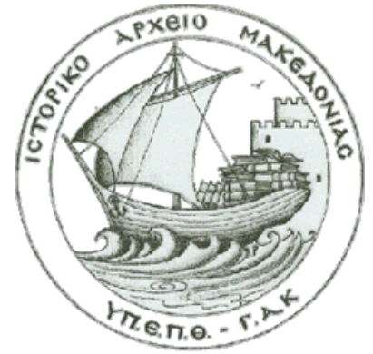
Εικόνα 3: Ιστορικό Αρχείο του Κράτους

Το Ιστορικό Αρχείο Μακεδονίας (IAM) είναι η περιφερειακή υπηρεσία των Γενικών Αρχείων του Κράτους. Το IAM ιδρύθηκε στην Θεσσαλονίκη το 1954 και όπως όριζε το διάταγμα της ίδρυσης του, στεγάστηκε στους χώρους της Εταιρείας Μακεδονικών Σπουδών.