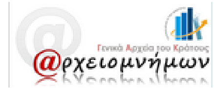
Εικόνα 4: Αρχαιομνήμων

«Τα Γενικά Αρχεία του Κράτους, συμμετέχοντας στις δράσεις του άξονα «Παιδεία και Πολιτισμός» του Επιχειρησιακού Προγράμματος «Κοινωνία της Πληροφορίας» ( http://www.infosoc.gr ), το οποίο εντάσσεται στο Γ΄ ΚΠΣ ( http://www.3kps.gr ) και συγχρηματοδοτείται κατά 80% από το ΕΤΠΑ ( http://www.europa.eu.int ) και 20% από εθνικούς πόρους, υλοποίησαν το έργο «Ανάπτυξη ολοκληρωμένων ψηφιακών πολιτιστικών συλλογών των Γενικών Αρχείων του Κράτους» 29 .