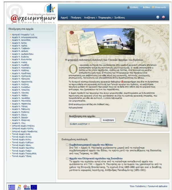
Εικόνα 5: Ιστότοπος

Η αναζήτηση των ψηφιακών τεκμηρίων μπορεί να γίνει χειροκίνητα και απλά, αλλά και με σύνθετη αναζήτηση, δηλαδή συμπληρώνοντας πεδία με στοιχεία του αρχειακού συνόλου.