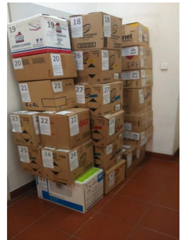
Εικόνα 7: Παραλαβή

Στο κεφάλαιο των αρχειακών εργασιών έχουν αναφέρει και τις επτά εργασίες. Η δεύτερη είναι η ταξινόμηση, η οποία περιλαμβάνει τέσσερα στάδια επεξεργασίας. Αυτά τα τέσσερα στάδια