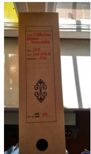
Εικόνα 10: Κυτίο εξωτερικά

Η καταγραφή γινόταν σε μορφή πίνακα, με τρεις στήλες τον αριθμό ενότητας, τον αριθμό των εγγράφων που ανήκουν στην ενότητα και τις ημερομηνίες τις περιέχονται σ' αυτές. Παρακάτω παρουσιάζονται όλες οι ενότητες του αρχειακού συνόλου.