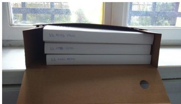
Εικόνα 9: Κυτίο εσωτερικά