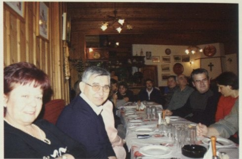
Στο γλέντι, στο τραπέζι