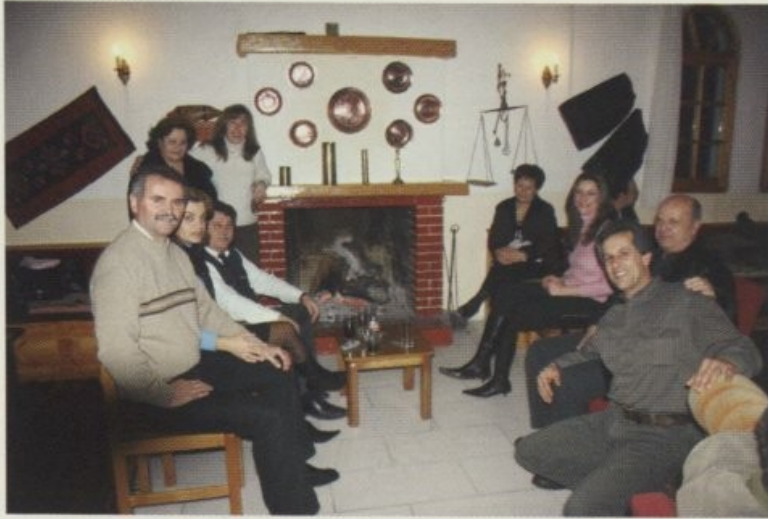
Το βράδυ στο τζάκι του ξενοδοχείου στη Βλάστη