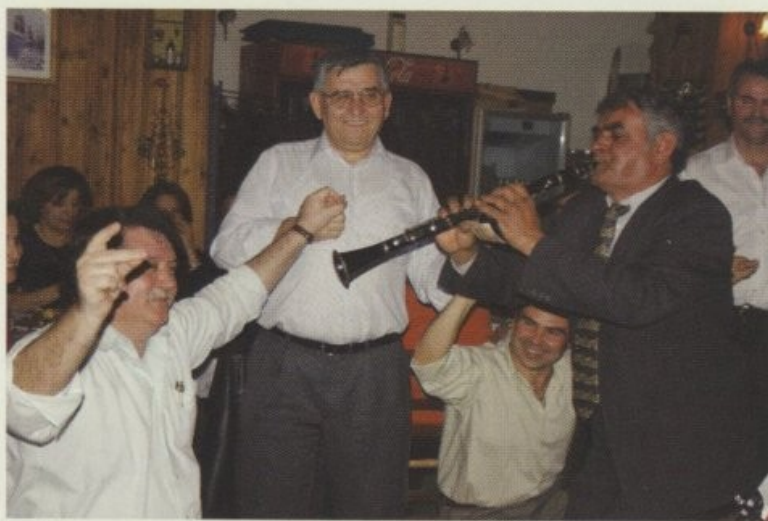
Χορός με κλαρίνα