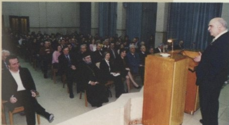
Από την εκδήλωση βράβευσης των φοιτητών μας από την Ελληνική Επιστημονική Εταιρεία.