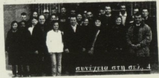
Συνέχεια στη σελ. 4

Την Πέμπτη 16 Δεκεμβρίου φοιτητές του ΤΕΙ Θεσ/νίκης από την σχολή Τεχνολογίας Γεωπονίας των τμημάτων Φυτικής Παραγωγής και Διοίκησης Γεωργικών Εκμεταλλεύσεων επισκέφθηκαν την εταιρεία "ΣΟΥΛΗΣ ΑΒΕΕ" στην Σκύδρα και ενημερώθηκαν