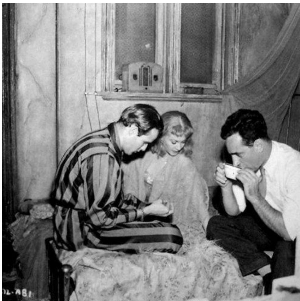
Εικόνα 25: Ο Elia Kazan, ο Marlon Brando και η Vivian Leigh στα γυρίσματα της ταινίας A Streetcar Named Desire .