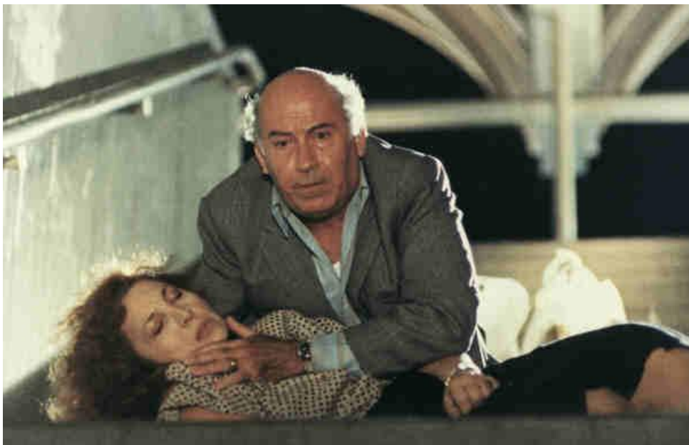
Εικόνα 19: Ο Θανάσης Βέγγος και η Χρυσούλα Διαβάτη στις Ήσυχες Μέρες του Αυγούστου .