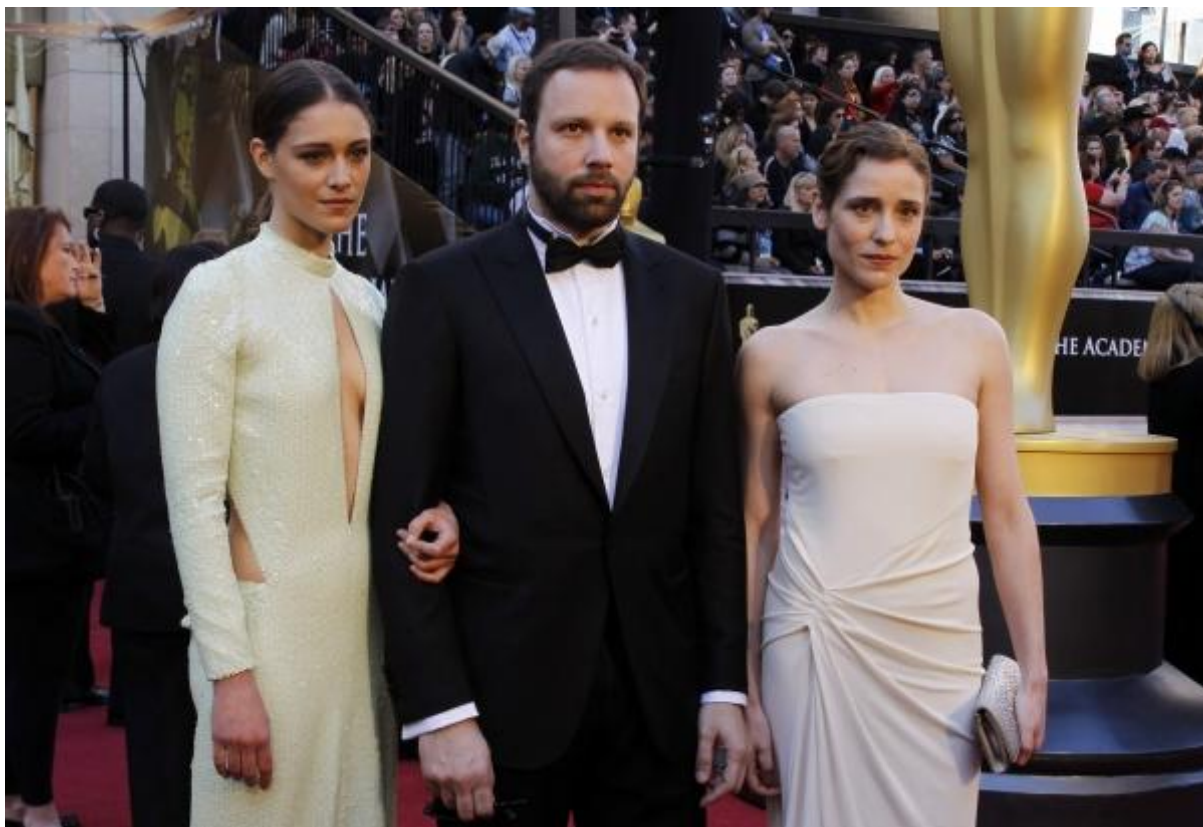
Εικόνα 24: Ο Γιώργος Λάνθιμος παρίσταται στα Όσκαρ του 2011 έχοντας υποψηφιότητα, μαζί με τις πρωταγωνίστριες της ταινίας.