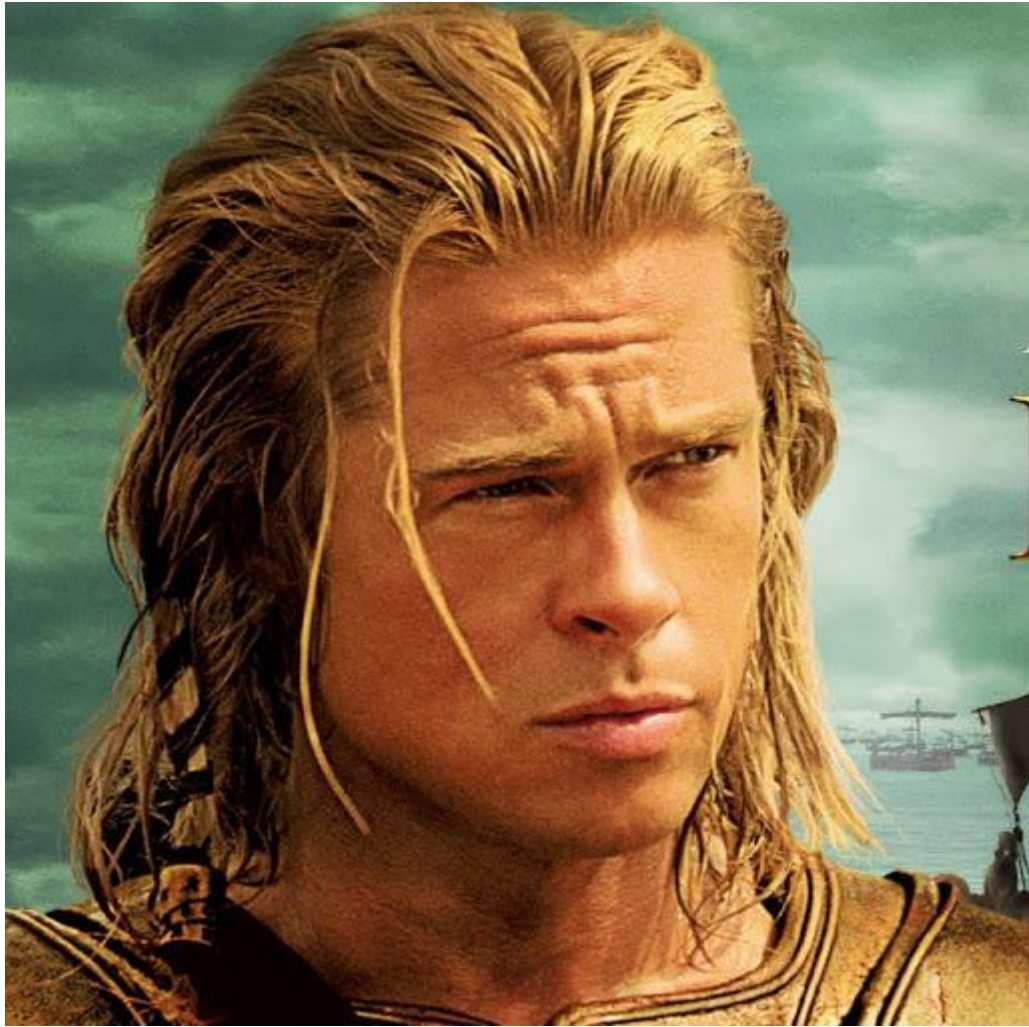
Εικόνα 9: Ο Brad Pitt ως Αχιλλέας