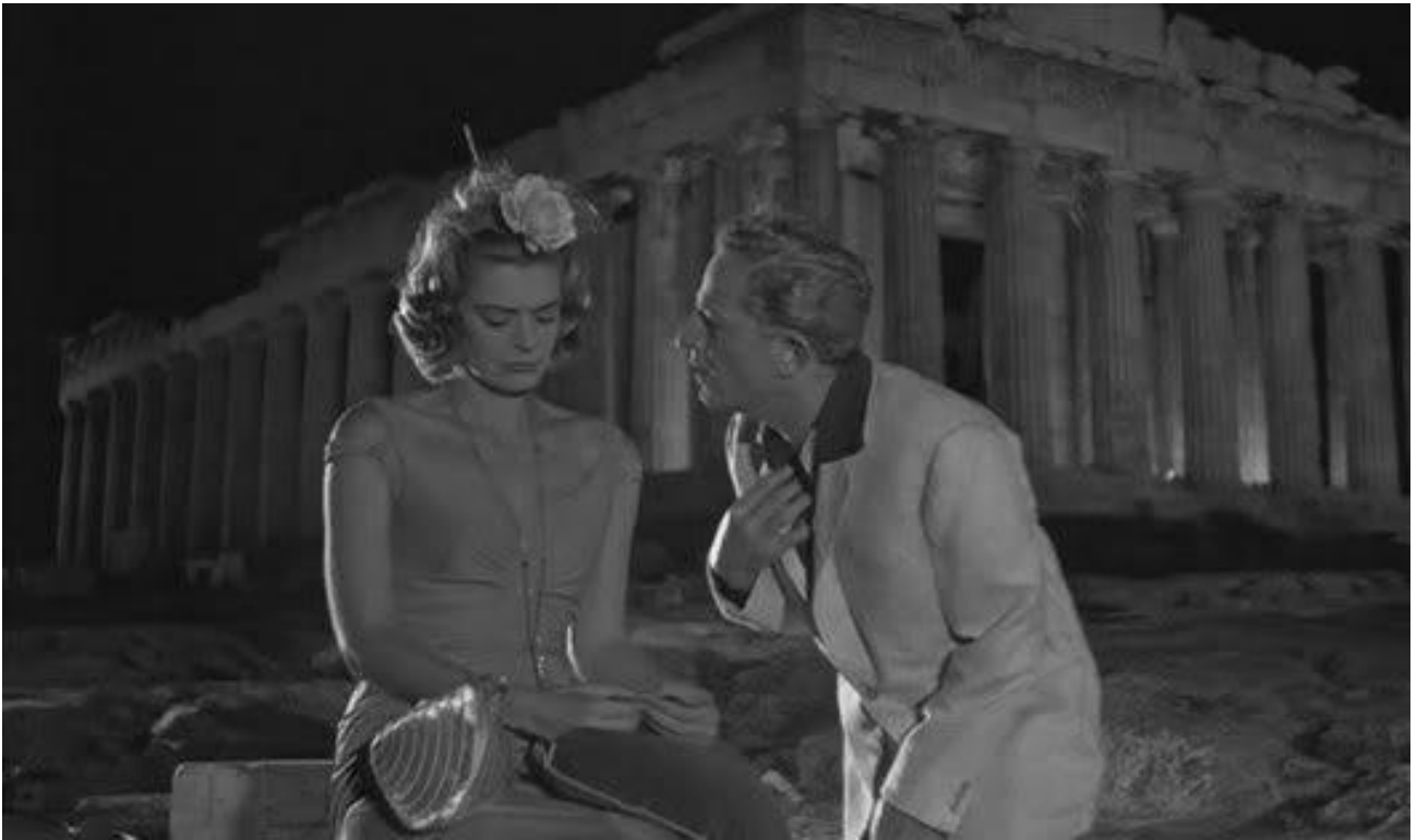
Εικόνα 15: Μελίνα Μερκούρη, Jules Dassin στο Ποτέ την Κυριακή .