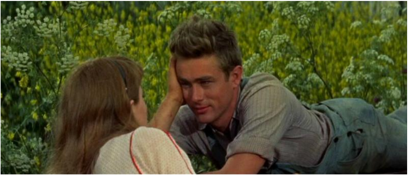
Εικόνα 26: Ο James Dean και η Julie Harris στην ταινία East of Eden