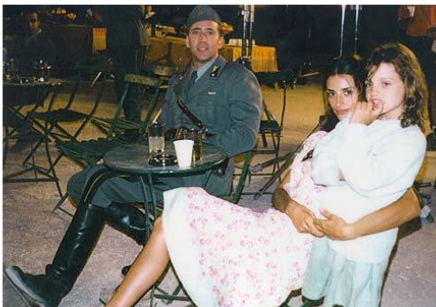
Εικόνα 5: Οι Πρωταγωνιστές της ταινίας ετοιμάζονται για την σκηνή περιμένοντας σε ένα τοπικό καφενείο της Κεφαλονιάς.