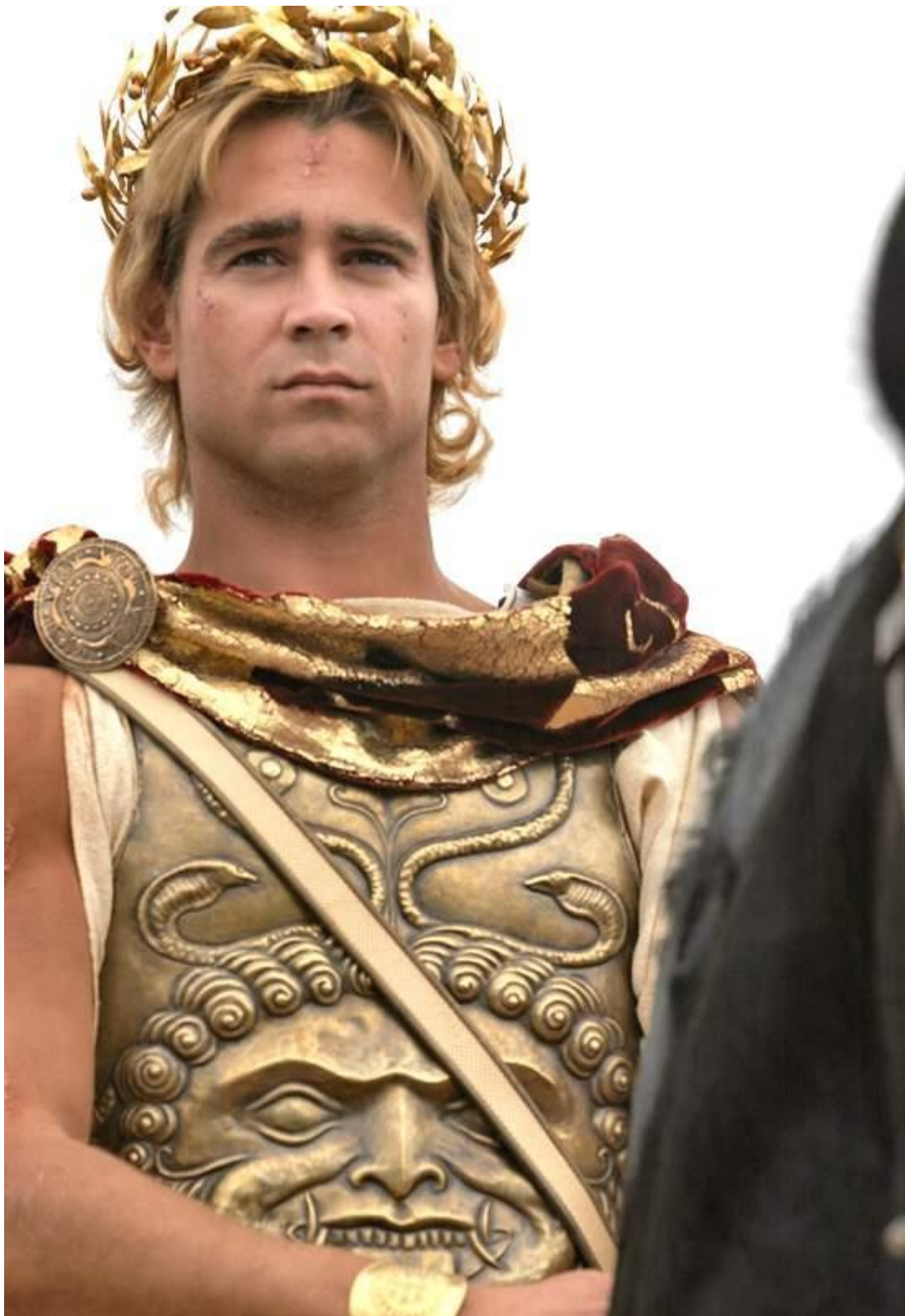
Εικόνα 10: Ο Μέγας Αλέξανδρος όπως τον φαντάστηκε ο Oliver Stone και απεικονισμένος από τον Colin Farrell.