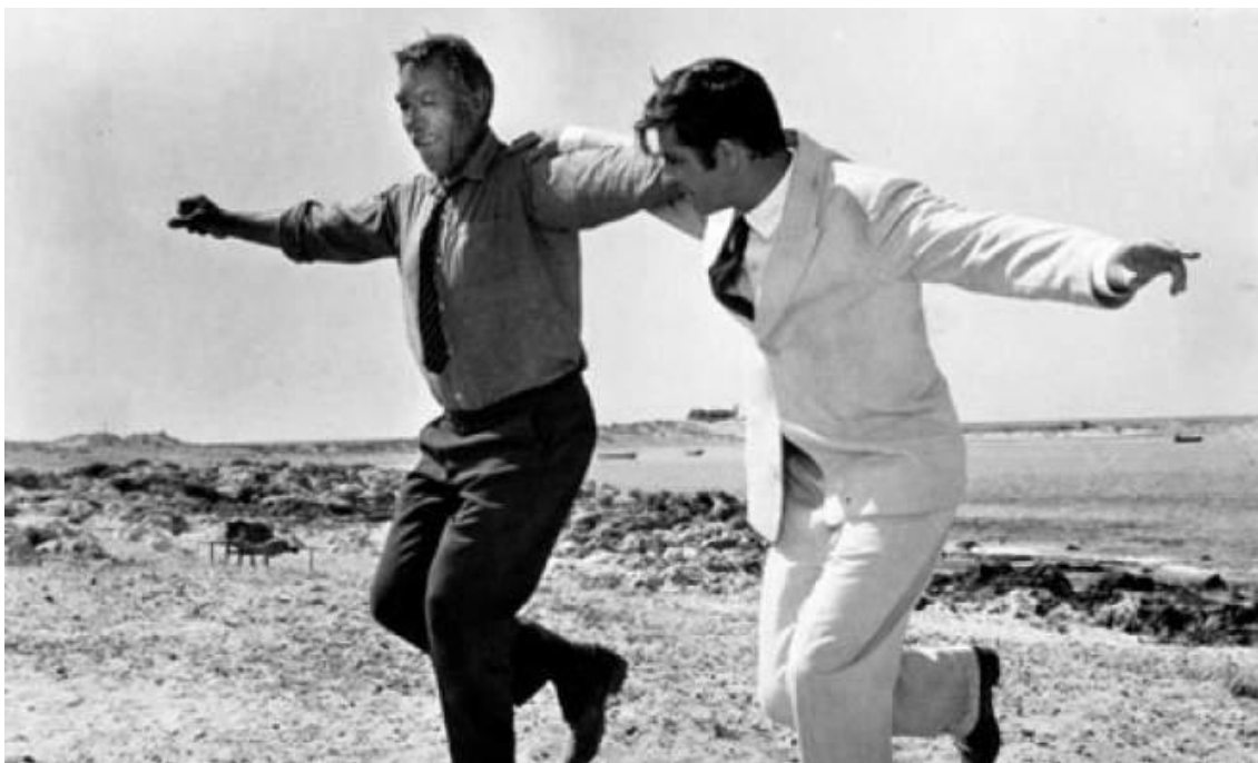
Εικόνα 2 : Η διάσημη σκηνή στην οποία ο Ζορμπάς και ο Basil χορεύουν συρτάκι.