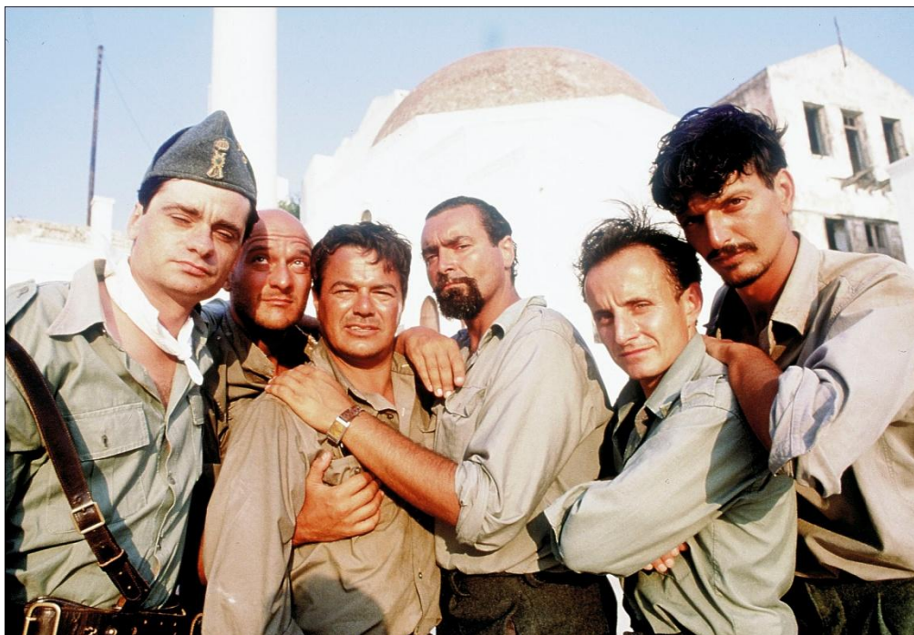
Εικόνα 4: Οι Ηθοποιοί του Mediterraneo με φόντο το όμορφο Καστελόριζο.