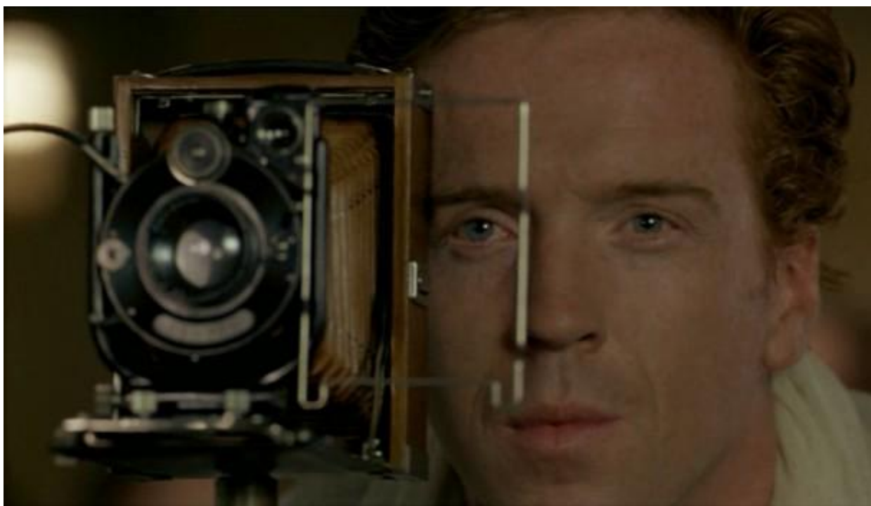
Εικόνα 22: Ο Πρωταγωνιστής της ταινίας, Damian Lewis.