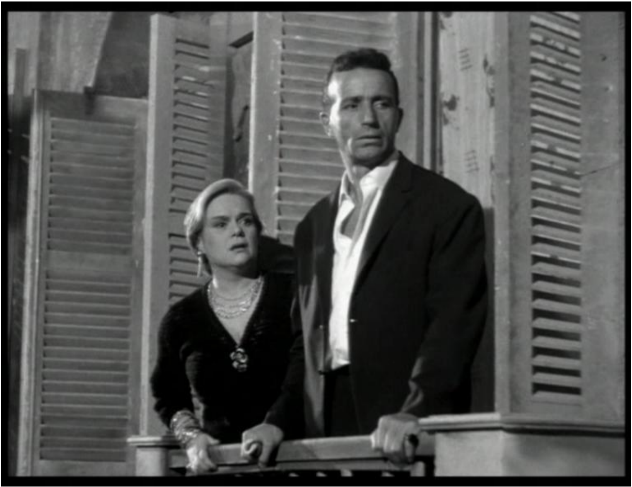
Εικόνα 16: Η τελευταία σκηνή στα Κόκκινα Φανάρια