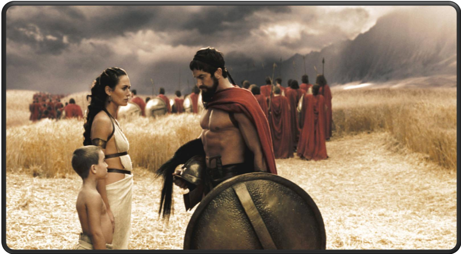
Εικόνα 11: Ο Λεωνίδας αποχαιρετά την γυναίκα και το παιδί του προτού αναχωρήσει για τις Θερμοπύλες