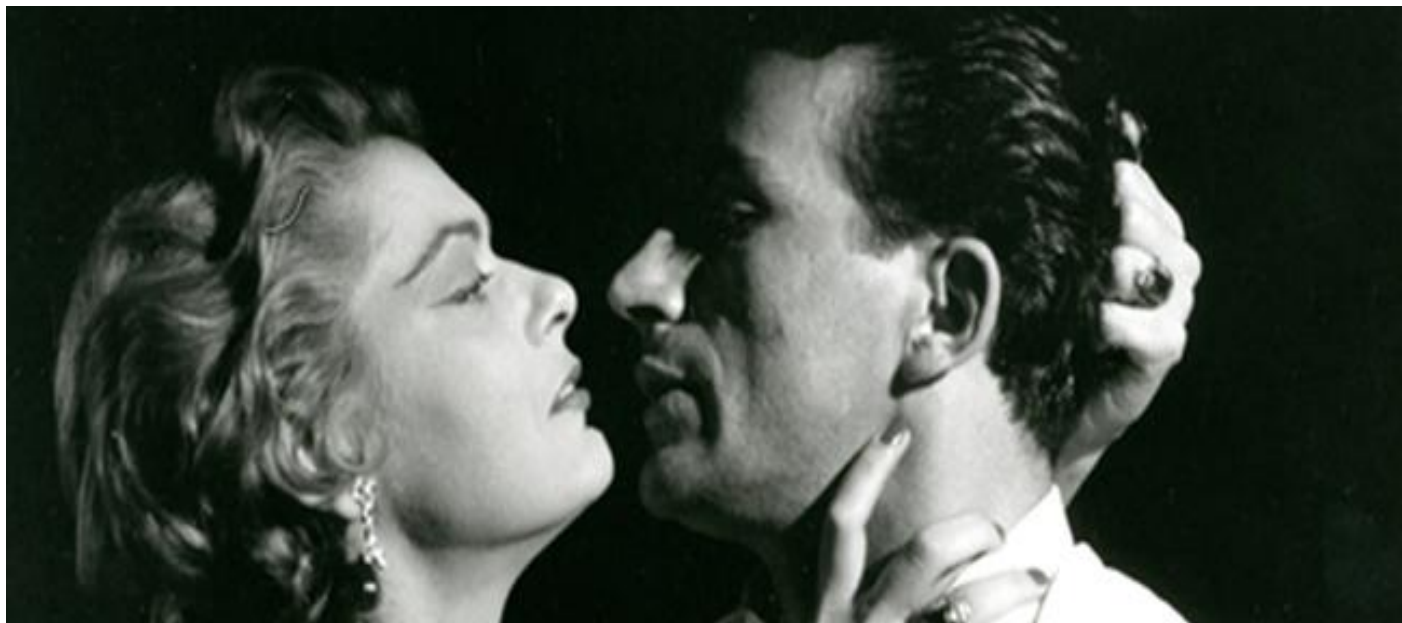
Εικόνα 12: Στέλλα, του Μιχάλη Κακογιάννη (Μελίνα Μερκούρη, Γιώργος Φούντας)