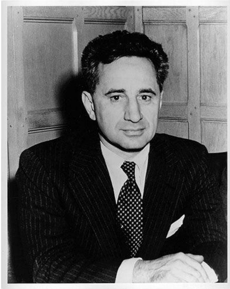
Εικόνα 1: Elia Kazan