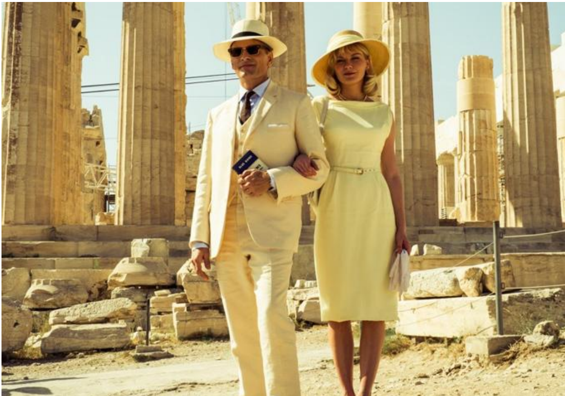
Εικόνα 7: Ο Viggo Mortensen και η Kirsten Dust με φόντο την Ακρόπολη.