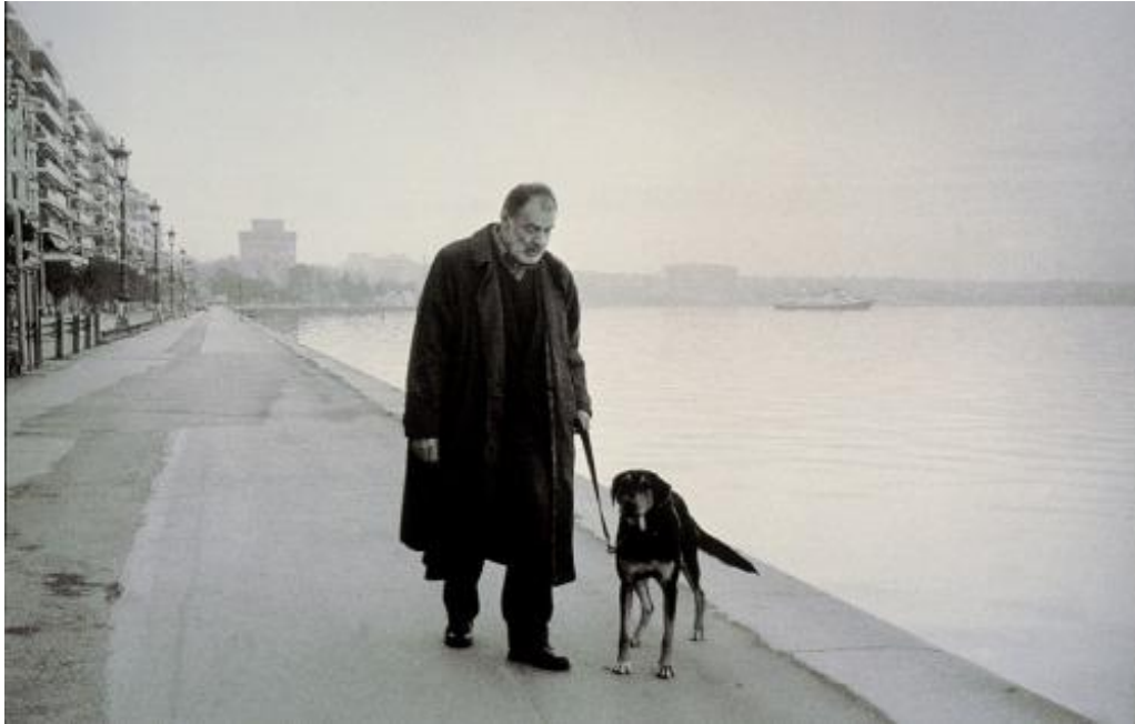
Εικόνα 19: Bruno Ganz. Αιωνιότητα και μια μέρα