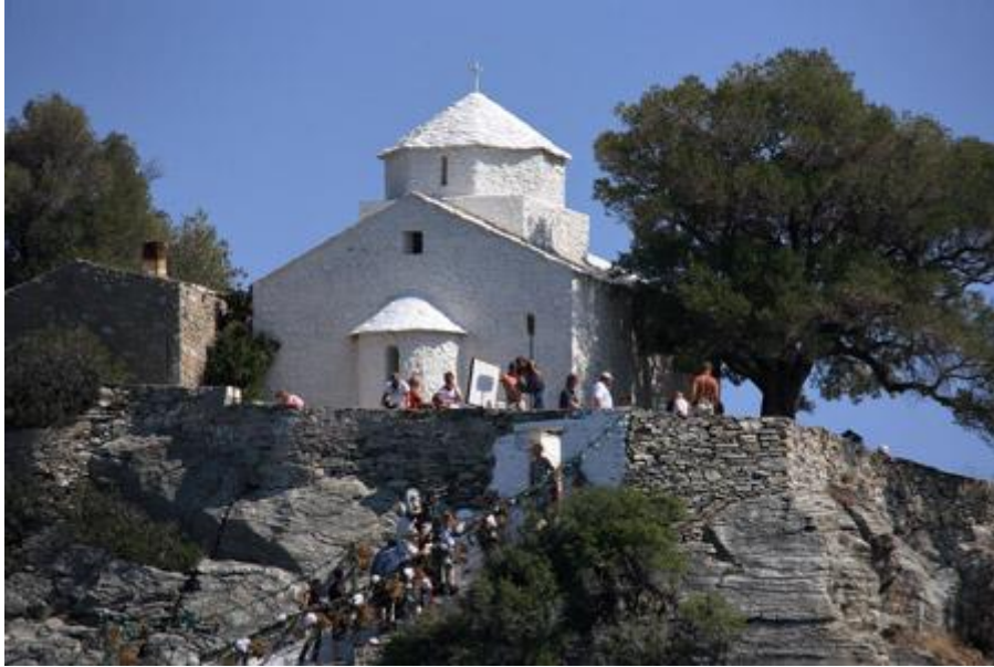
Εικόνα 6: Το μοναστήρι του Άγιου-Ιωάννη στο οποίο γυρίστηκε η σκηνή του γάμου.